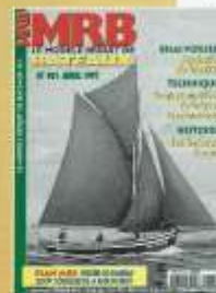
Photo de couverture : La Bergère de Domrémy, Aiguillon de Pierre Le Cos.

Toute reproduction ou représentation intégrale ou partielle, par quelque pro- cédé que ce soit, des pages publiées dans la présente publication sans l'autorisation de l'éditeur, est formellement interdite. Toute contrefaçon, imitation ou réimpression sans autorisation préalable constitue une violation des droits de propriété intellectuelle et sera poursuivie en justice.